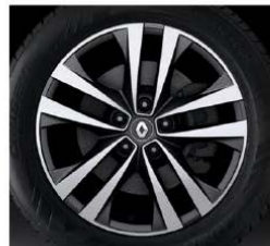
Rin bitono 18" (Intens)