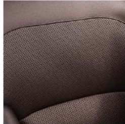
Vestiduras en piel perforada Siena Brown (Iconic)