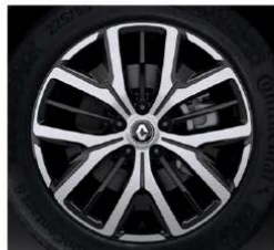
Rin bitono 19" (Iconic)