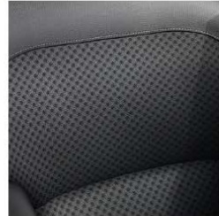
Vestiduras en tela negra (Intens)