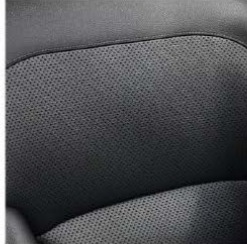
Vestiduras en piel perforada Titán Black (Iconic)